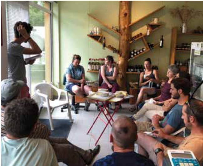
Séance de travail - GIEE Champsaur Lait.

ajoutée (transformation fromagère collective, mise en avant de l'identité territoriale et émergence d'un circuit court de commercialisation). Il s'agissait aussi de faire évoluer les pratiques des éleveurs pour un meilleur respect de l'environnement et une augmentation de la qualité du lait et des produits finis.